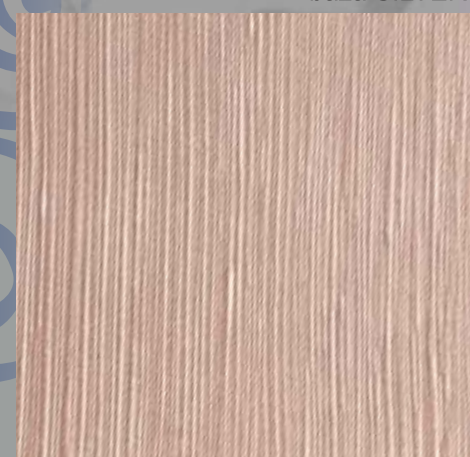
IMPD 09 S baza SILVER