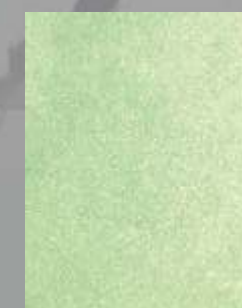
IMPD 15 S