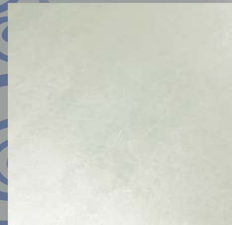
IMPD 05 S baza SILVER