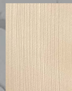
IMPD 08 S