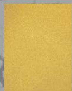
IMPD 04 G