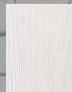
IMPD 11 S