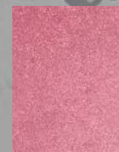
IMPD 12 S