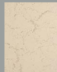
JD 01 D / RAL 1015