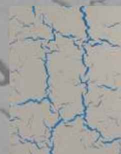
JD 04 D / RAL 5015