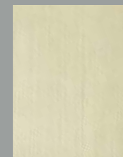
IMPD 03 S