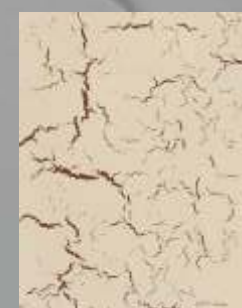
JD 05 D / RAL 8015