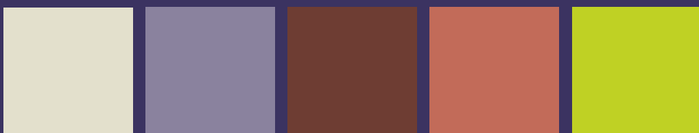
JD 11 D JD 12 D JD 13 D JD 14 D JD 15 D