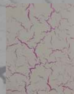
JD 04 D / RAL 4001