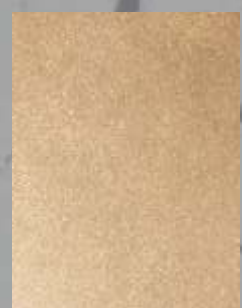
IMPD 10 S