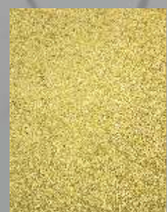
IMPD 05 G