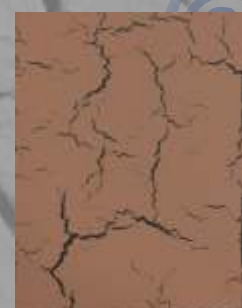
JD 06 D / RAL 5004