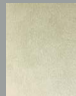
IMPD 02 S