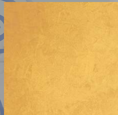
IMPD 02 G baza GOLD