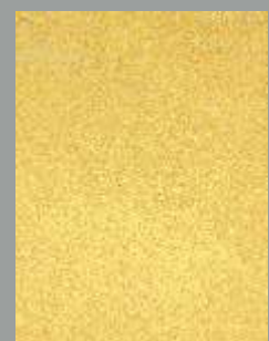
IMPD 01 G