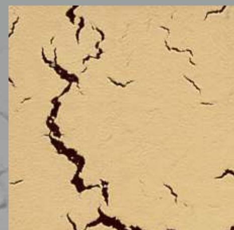
CRACKING JD 18 D / RAL 8015