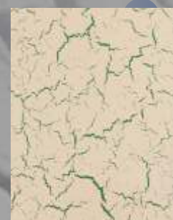
JD 05 D / RAL 6029