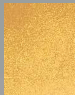
IMPD 02 G