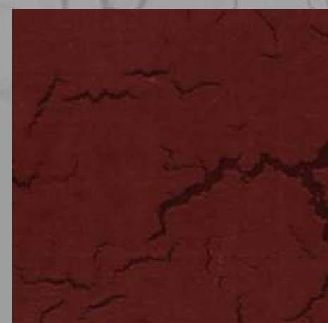
CRACKING JD 13 D / RAL 8015