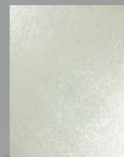
IMPD 05 S