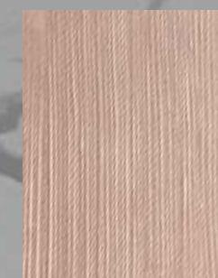
IMPD 09 S