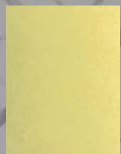
IMPD 07 S