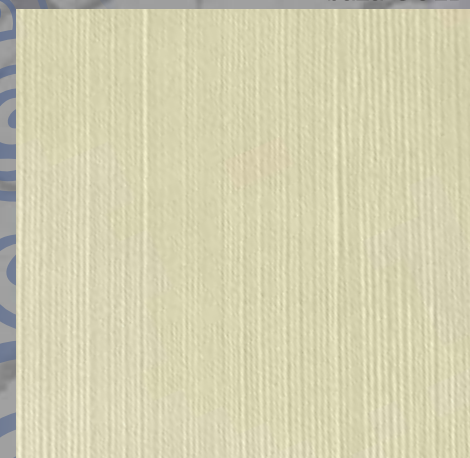
IMPD 03 S baza SILVER