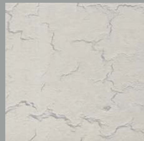
CRACKING JD 11 D / RAL 7035