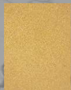
IMPD 03 G