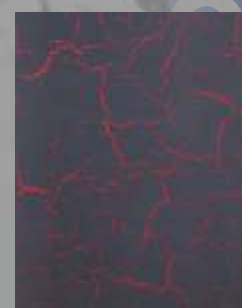
JD 10 D / RAL 3001