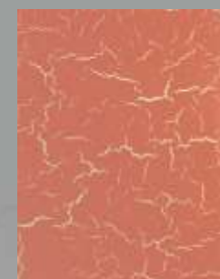
JD 14 D / RAL 1015