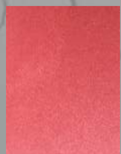
IMPD 13 S