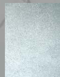
IMPD 14 S