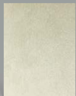
IMPD 04 S