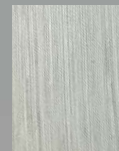
IMPD 06 S