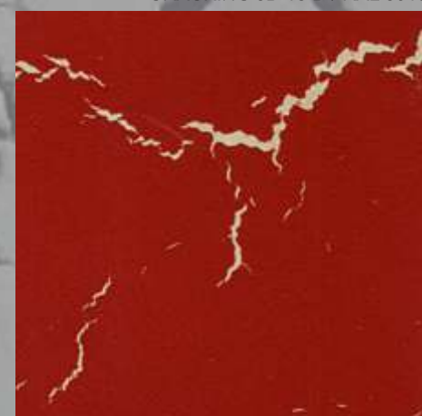
CRACKING JD 08 D / RAL 1015