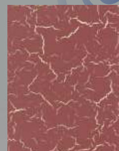
JD 13 D / RAL 1015